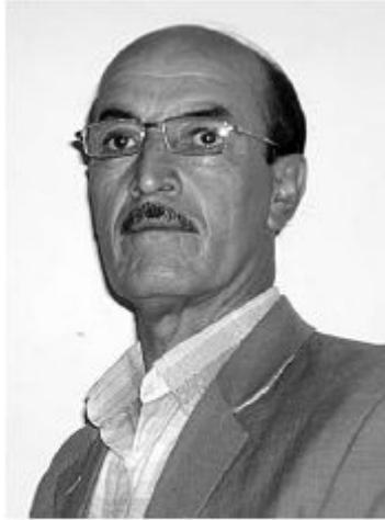
سالج ھلاج ■

رؤژی پینجشہممہ 2008 / 10/9 لہلاپہرہی بیروپای رؤژنامہی کوردستانی نوچ- دا، سہلام مہلا كہريم بابہ تہكی لہسہر كتيبهكہی من بہناوی) گولبژيريك لہشيعرو شاعيراني گہرميان، يان گولبژيريك لہبہرہم و پړوژہو بيړوكہی ئەم و ئەو) بلاوكردوتہوہ. منيش چہند سہرنجتيكي خؤم ھہيہ بؤئہو برا بہرپژہ .