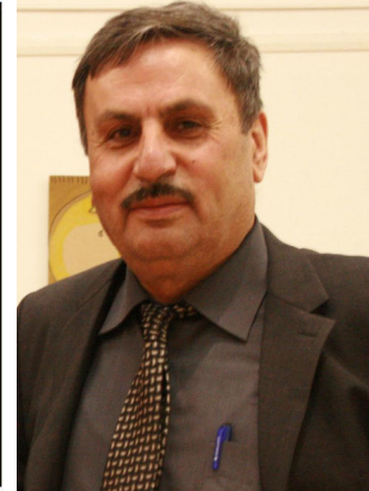
وەرگێڕ: مستەفا رابەر

ئێوارە یەکی سەرەتای هاوین لە دەرهەوی مأل لە سایە ی درەختێکی زل لە نزیک خانوی کێلگەمان دانیشتبوین پورە پایچل لە سەرکۆنە کورسیەک بەرامبەر منالەکانمان دانیشتبو ژنیکی رەشپێستی قەبە ی بالا بەرز ی تەمەن شەست سالی بە شنگ و تاقەت.