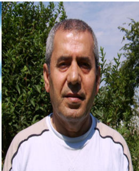
هه مه فه ریق هه سه نه

ههیمن و بۆنی غه ریبی، کتیبیکی دیکه ی نوئی هه مه فه ریق هه سه نه، (238) لاپه ره یه، له لایه ن ده زگای ئاراسه وه، له هه ولێر، دوامای سالی 2008 چاپ و بلا بووه ته وه. بریتیبه له (16) وتار و لیکۆلینه وه، له مه پ زمان و ئه ده ب و هونه ر و پرسی فه ره هه نگ، به م ناو نیشانانه ی لای خواره وه: