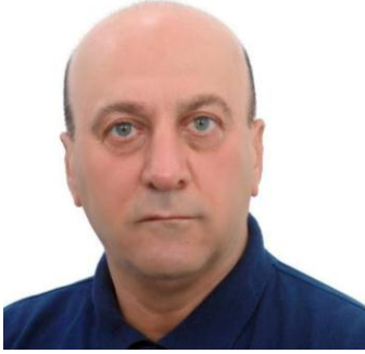
عہدولہا کہریم مہحمود